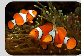
Kooperationen / Partnerschaften