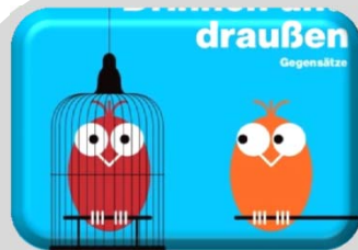
Drinnen / Draussen